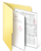
【一】成绩单及成绩排名