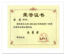
比赛名称_名次等级.jpg