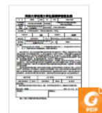
xxx大学_学生姓名_报名表.pdf