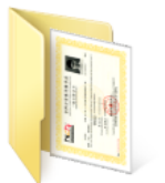
【二】重要获奖证明、科研成果、专利、论文