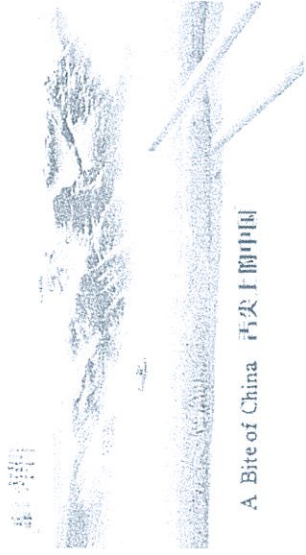
A Bite of China 2

3、结合视觉传达艺术相关理论分析以下两幅宣传海报，并阐述你认为应如何设计一幅优秀的影视作品宣传海报。（视觉传达艺术方向答题）