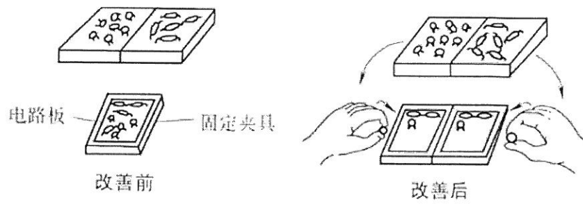
图1 题三-2 示意图