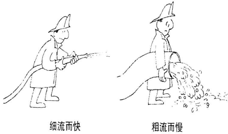
图2 题三-3 示意图