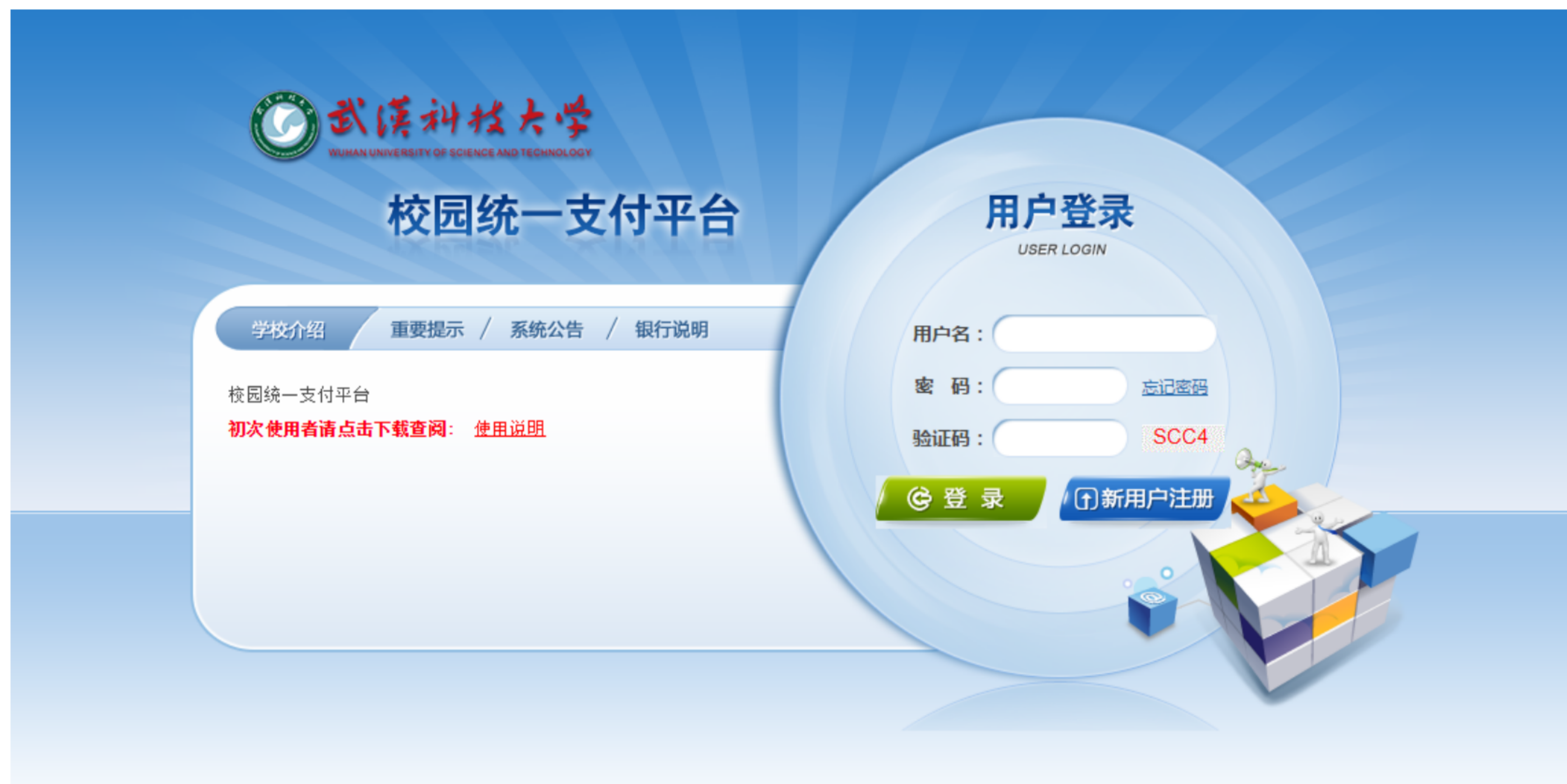
图 3.1-1 统一支付平台登陆界面

在浏览器地址栏输入http://202.114.249.79，如图3.1-1所示。登陆之后显示个人欠费信息，如图3.1-2所示。