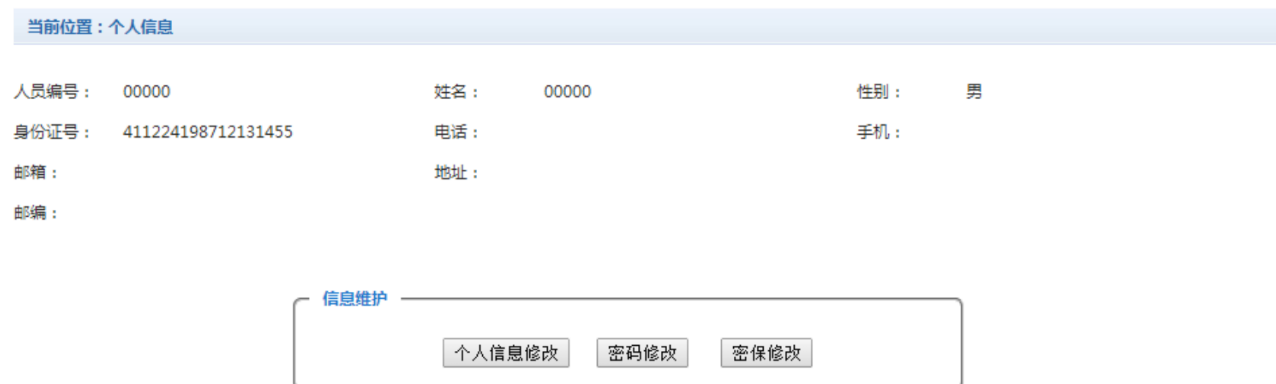
图 3.2-1 个人信息维护界面

登陆支付平台后，点击导航栏的个人信息按钮，显示个人信息确认及维护界面。如图3.2-1所示。 请确认个人信息无误后再进行缴费，避免误交费。（在校生 密码修改在财务办公平台）