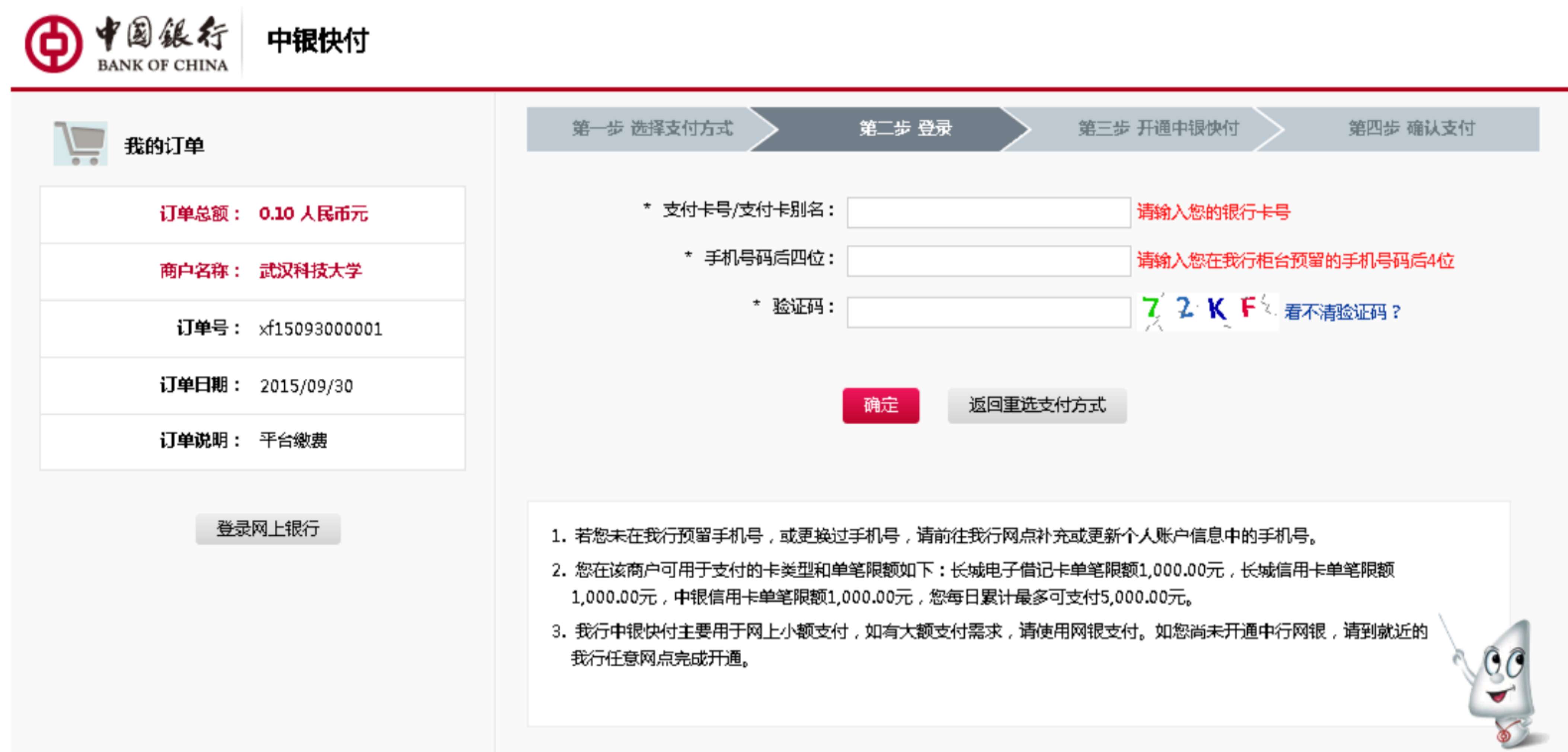
图 3.4-6 中银快付

选择相应的支付方式，并登陆进行缴费，中银快付支付界面如图3.4-6，网银支付界面如图3.4-7。