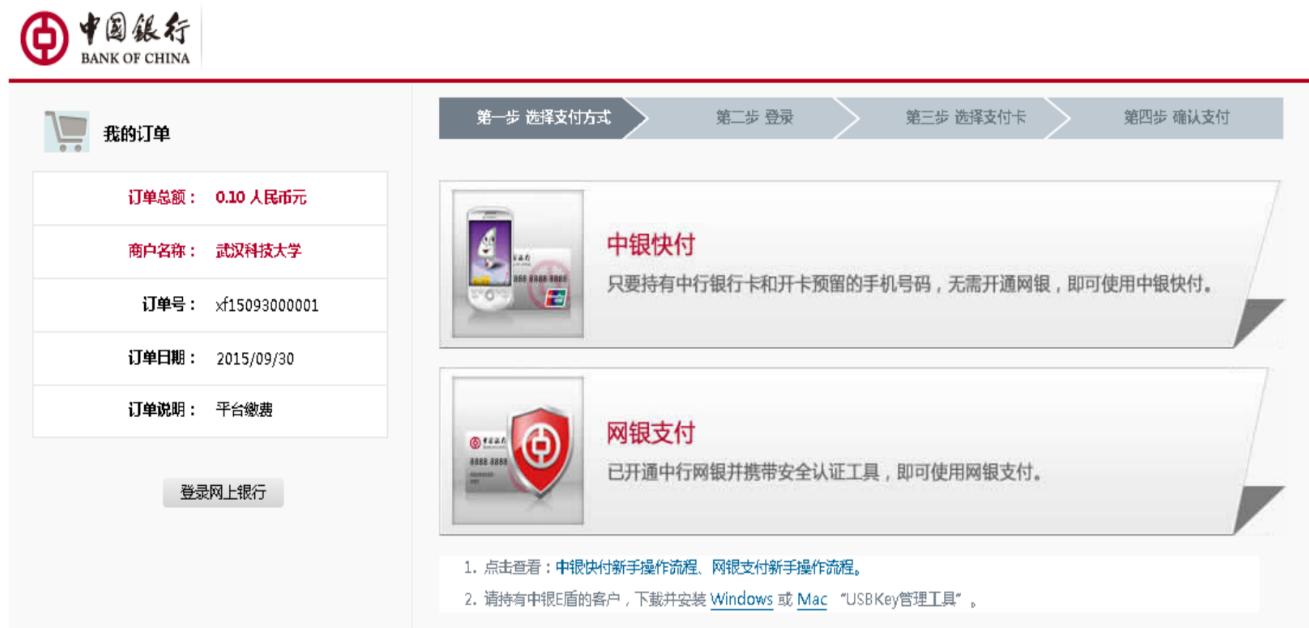
图 3.4-5 中国银行网上支付

中国银行网上支付，如图3.4-5所示，允许使用各种银行卡进行缴费。 注意：请确认商户名称：武汉科技大学，金额与系统缴费金额一致后再缴费。