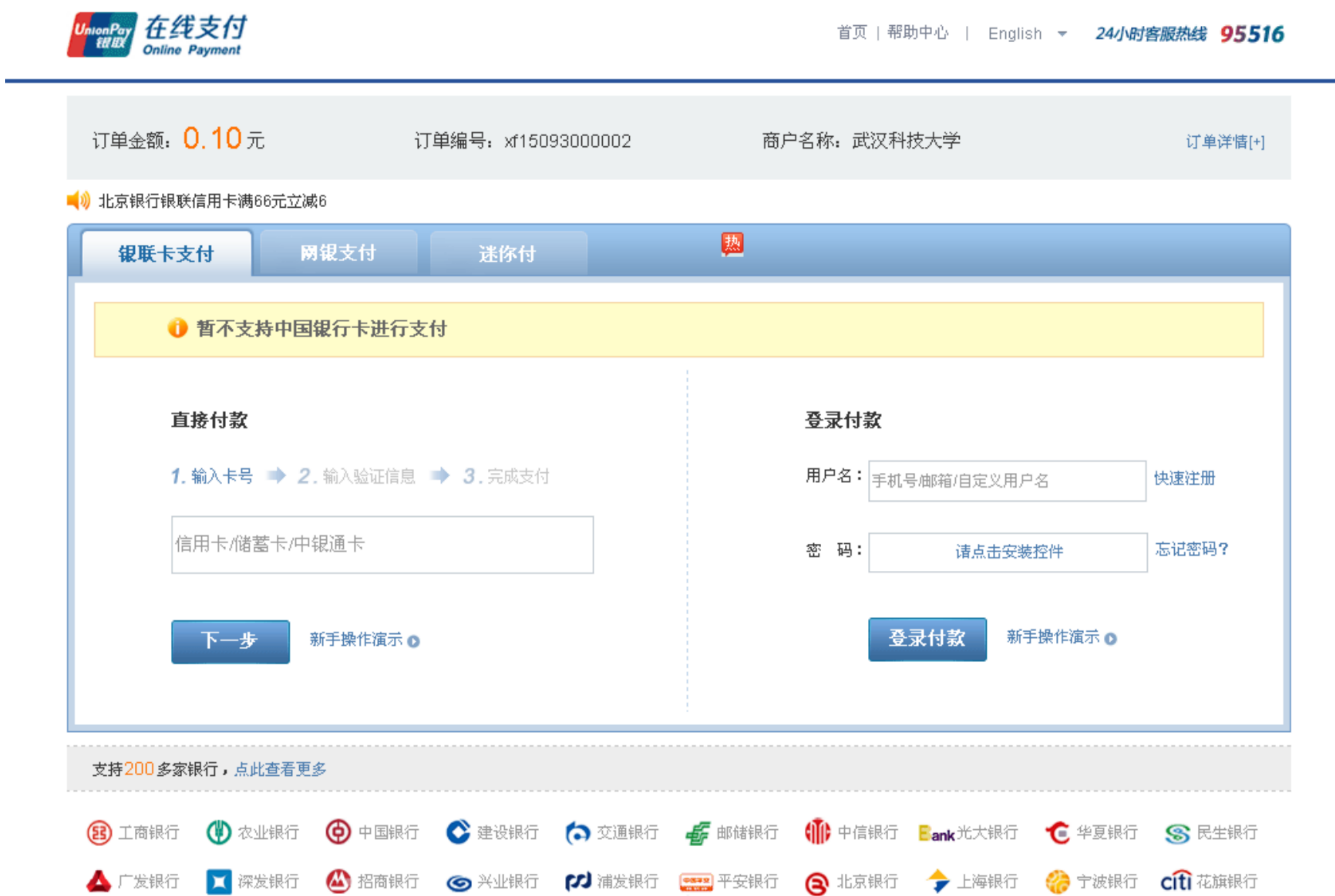
图 3.4-8 银联支付

如图3.4-4所示，确定支付金额无误后，点击确定支付，进入如图3.4-8所示中国银行支付界面，登陆后完成支付。