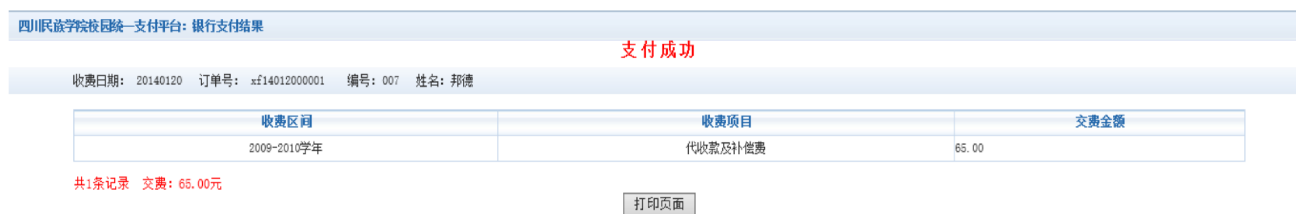
图 3.4-10 支付成功