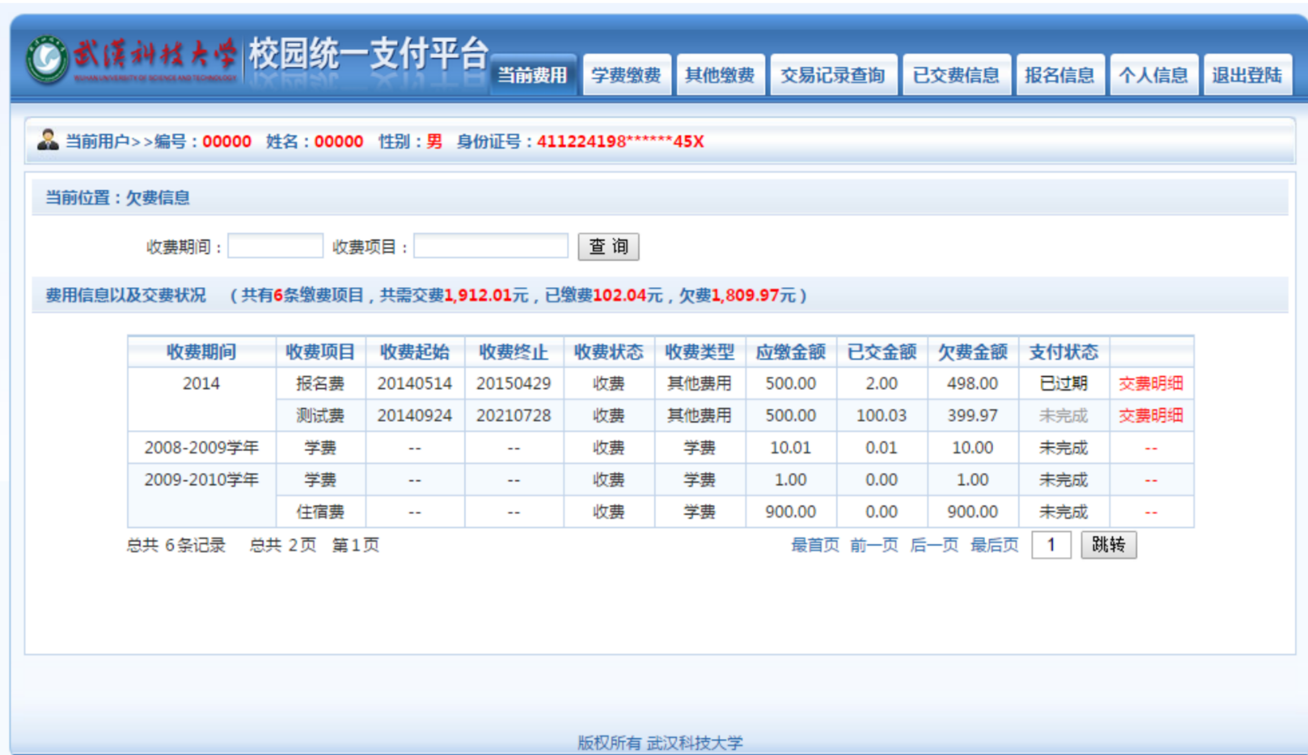
图 3.1-2 统一支付平台登陆后页面