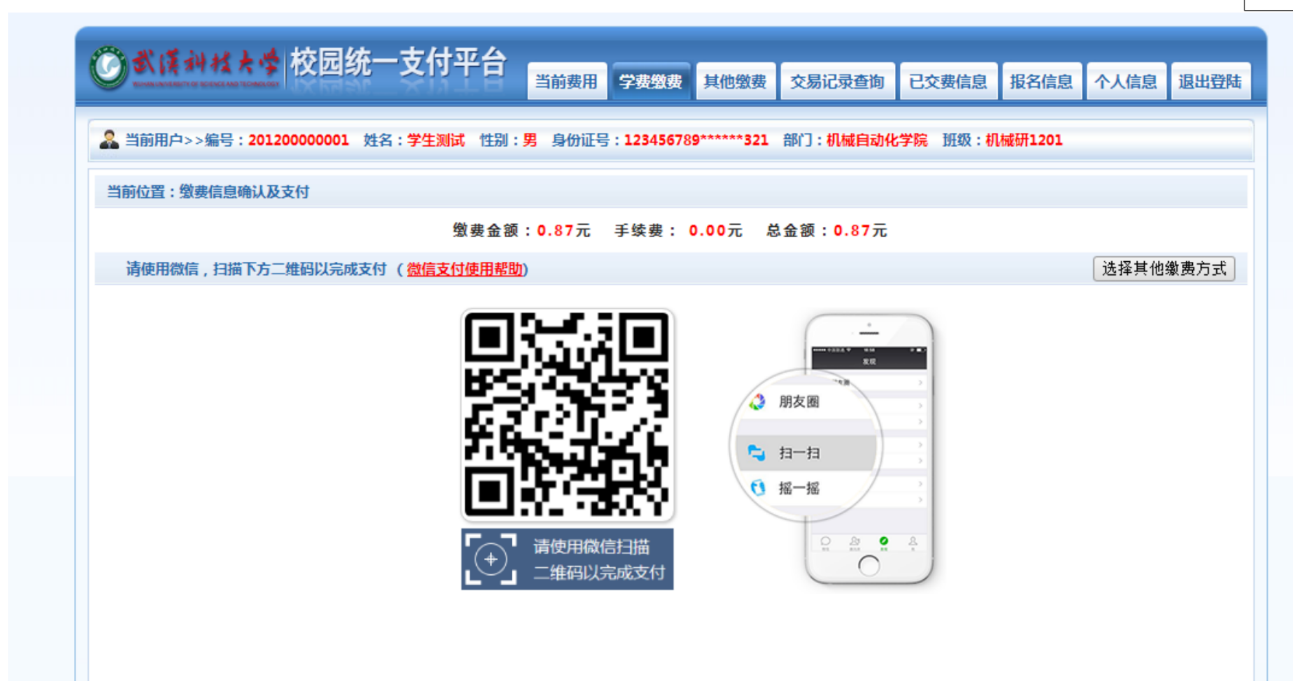
图 3.4-9 微信支付