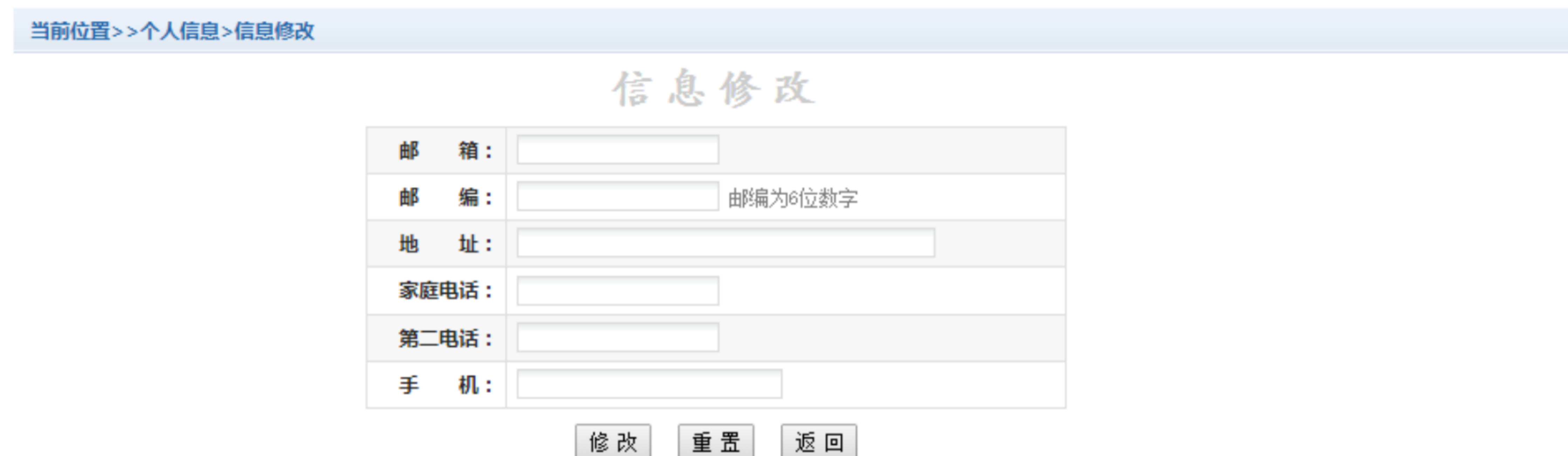
图 3.2.1-1 个人信息修改

点击个人信息界面的个人信息修改，显示3.2.1-1所示的个人信息维护界面。在相应的输入框，输入需要修改的个人信息，点击“修改按钮”完成个人信息维护。未保存前，点击“重置”按钮，还原个人信息。