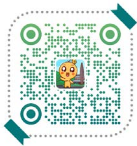
微博：上海国家会计学院研究生部

D:691001598)，回看政策宣讲、经验分享等视频，或是关注抖音号“上海国家会计学院研究生部”参与直播互动，直接了解一手信息。