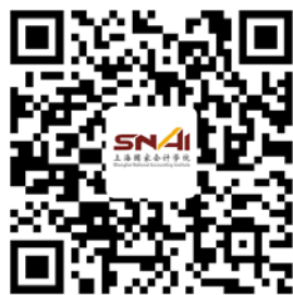
微信：上海国家会计学院