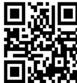
抖音号：上海国家会计学院研究生部