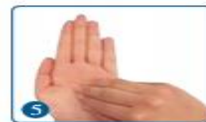
5 指尖磨擦掌心，两手互换