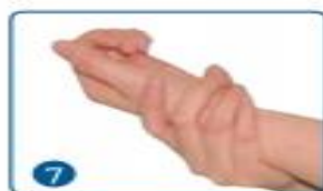
7 一手旋转揉搓另一手的腕部、前臂，直至肘部；交替进行