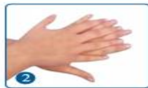
2 手指交错，掌心搓手背，两手互换