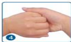
4 两手互握，互擦指背