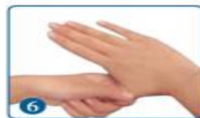
6 拇指在掌中转动，两手互换