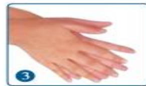
3 手指交错，掌心搓掌心